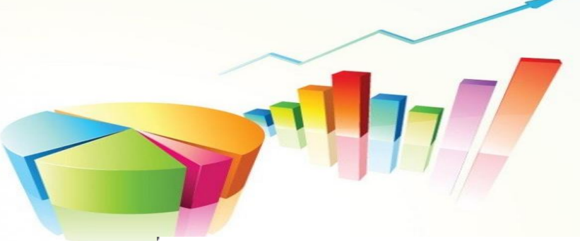
สรุปการใช้รถตู้คณะศิลปศาสตร์ ประจำปีงบประมาณ 2566 (1 ตุลาคม 2565-30 กันยายน จำนวน (ครั้ง))